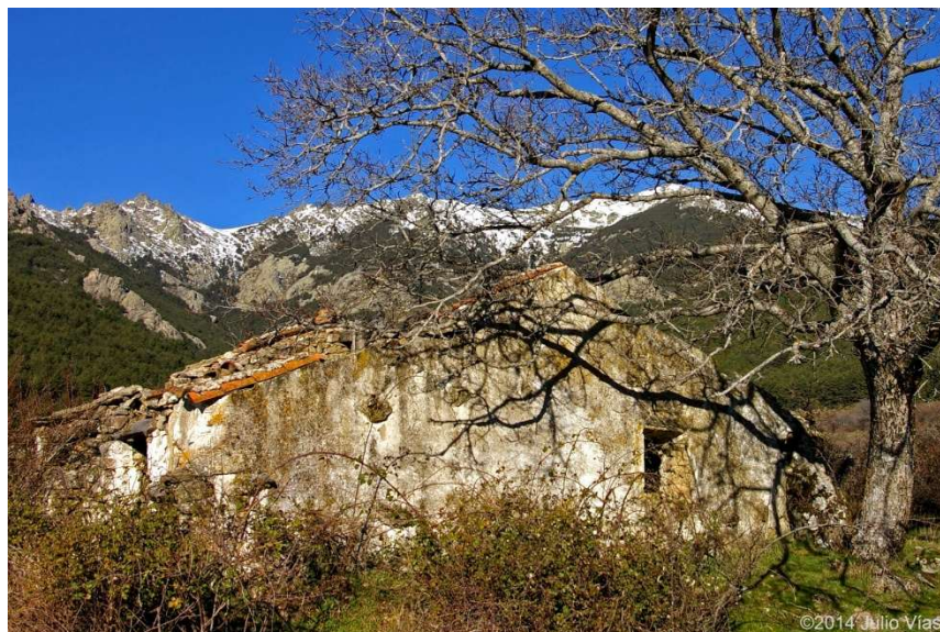
Las ruinas de la casa en la actualidad. El viejo nogal plantado por sus antiguos moradores sigue creciendo a su lado