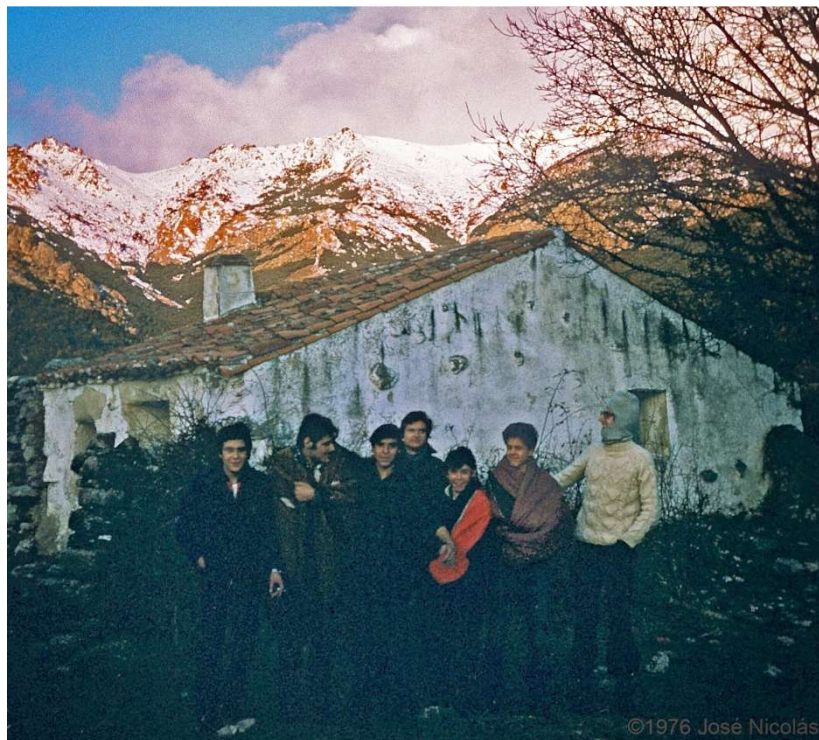
El autor con un grupo de amigos frente a la casa de los Cierros del Bailarín, al amanecer del 22 de febrero de 1976

Fragmento de un artículo de "Julio Vías"