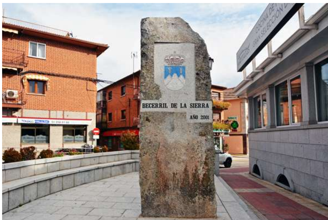
Becerril de la Sierra, qué ver e historia | Cuenca del Guadarrama