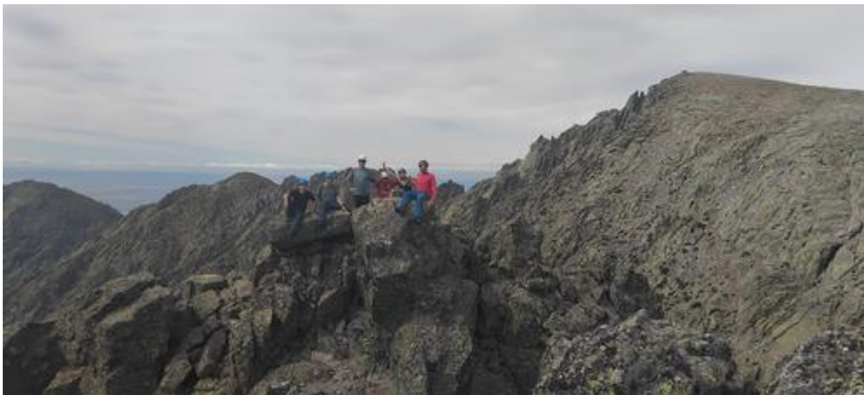
Ilustración 15. Cumbre G.Galayo y La Mira.

nuestra atención y, antes de que nos demos cuenta, estamos arriba retratándonos.