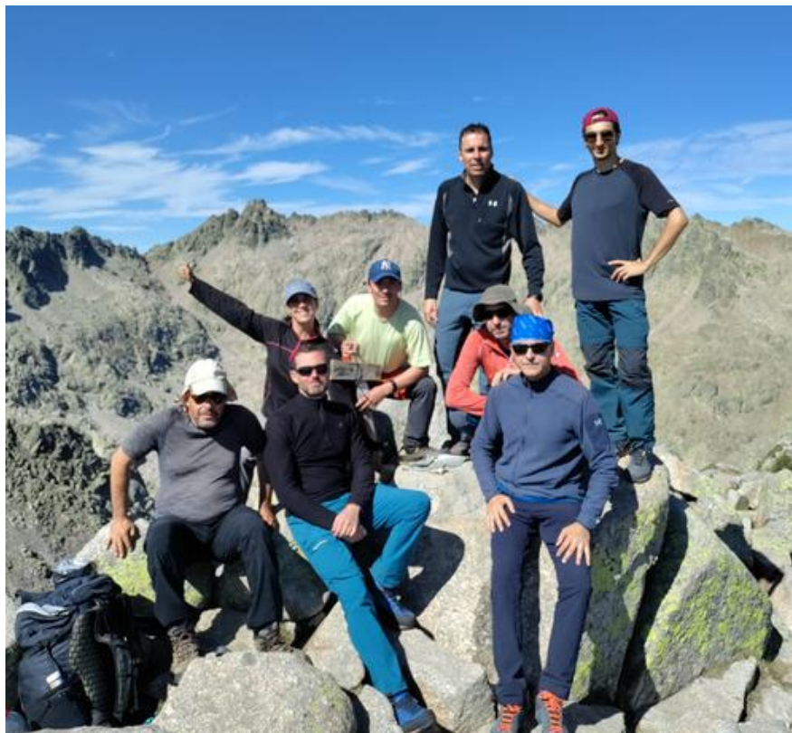
Ilustración 7. Cumbre del Morezón.

Y cuando nos queremos dar cuenta estamos en el pico observando la Laguna Grande con su refugio minúsculo desde la distancia.