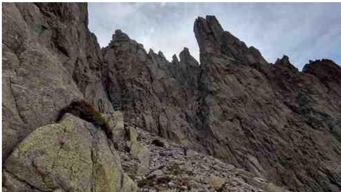
Ilustración 14. Subiendo hacia el G.Galayo

Antes de llegar al refugio giramos a la izquierda y comenzamos a subir con destino a la base del G.Galayo. Trepadas y más trepadas, hasta que llegamos a la base de la cumbre. Muy entretenido.