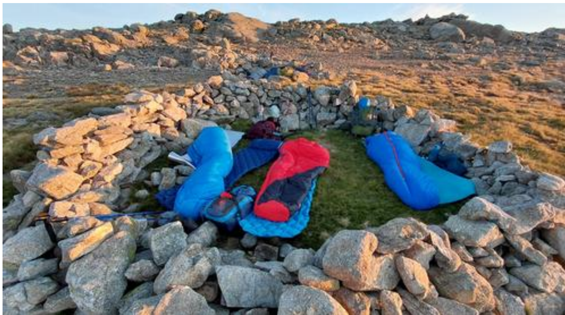
Ilustración 12. Vivac junto al Refugio de los Pelaos

Cena y a dormir, alguno incluso sin cenar. Noche agradable de temperatura.