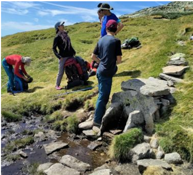
Ilustración 8. Fuente del Refugio del Rey

Pasamos por el Refugio del Rey, y hacemos acopio de agua en la fuente cercana. El caño está reluciente, pues pillamos in fraganti a un ternero bebiendo como si su madre estuviera dándole de comer. Hay que compartir.