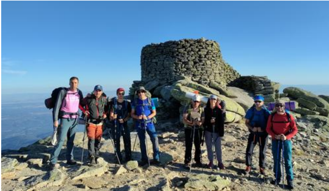
Ilustración 10. La Mira

Finalmente, llegamos a nuestro objetivo del sábado, desde donde tenemos una visión privilegiada del reto del domingo, Los Galayos.