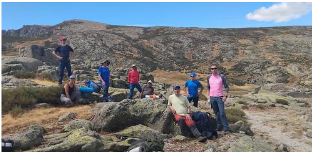
Ilustración 9. Camino de La Mira.

Con nuestras botellas llenas de agua fría continuamos rumbo a La Mira, con tranquilidad y disfrutando de cualquier momento para hacer una paradita.