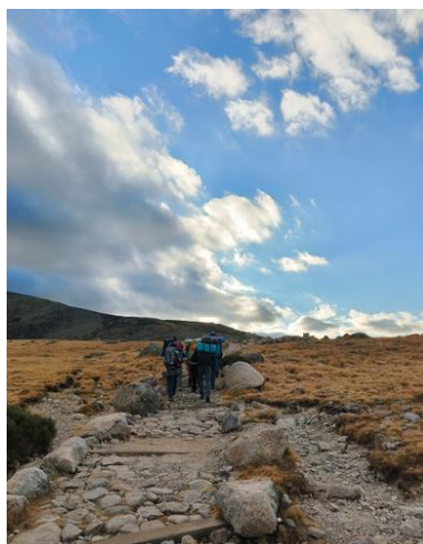
Ilustración 3. Empedrada, Las Escaleruelas

Una vez reunidos y, finalizados los últimos preparativos, comenzamos a subir por la senda señalizada ( PR-AV17 ) y empedrada (Las Escaleruelas), llegando al arroyo y al Prado de las Pozas donde nos distribuimos buscando un buen lugar horizontal y resguardado donde pernoctar (1900 m).