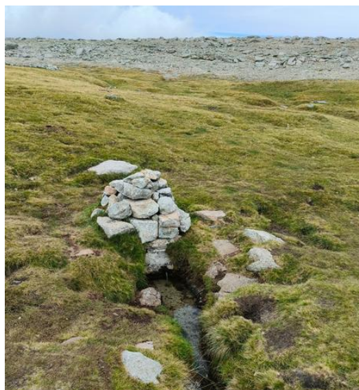
Ilustración 11. Fuente del Refugio de los Pelaos

Bajamos unos cientos de metros y llegamos al Refugio de los Pelaos que, junto a su fuente de agua fría, nos sirve pasar la segunda noche. Esta vez, utilizando los vivacs de piedra existentes, hacemos varias agrupaciones para dormir lo más resguardados posible.