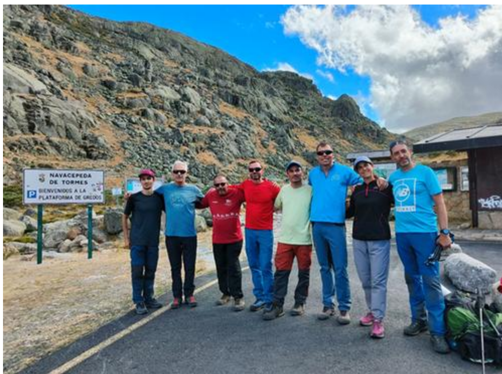
Ilustración 16. Llegada del grupo a la Plataforma (+el fotógrafo)

Bajamos de la cumbre, y tras un breve descanso para calmar la adrenalina, seguimos la Trocha Palomo, rodeando el Gran Galayo, que nos lleva de nuevo a la fuente del Refugio de Los Pelaos, donde hacemos el último repostaje de agua. Deshacemos parte del camino hacia El Morezón, hasta que ponemos dirección directa a la Plataforma.