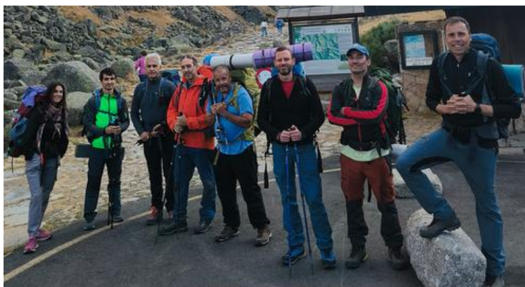
Ilustración 2. Grupo Vivac (+el fotógrafo)

Comenzamos la jornada aproximadamente sobre las 19.00 h en la Plataforma de Gredos, punto de inicio y final de nuestra travesía. Equipo de 9 amantes de la montaña dispuestos a disfrutar de Gredos 48 h, sin interrupción, huyendo de las comodidades cotidianas a las que estamos acostumbrados con plena integración en la montaña.