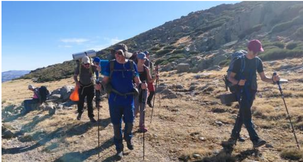
Ilustración 6. Camino del Morezón.

Comenzamos la ruta y ponemos rumbo a nuestro siguiente objetivo, El Morezón (2390 m). Poco a poco vamos cogiendo altura y hacemos nuestras paradas de rigor, hidratándonos y comiendo algo ligero para no disminuir nuestras energías.