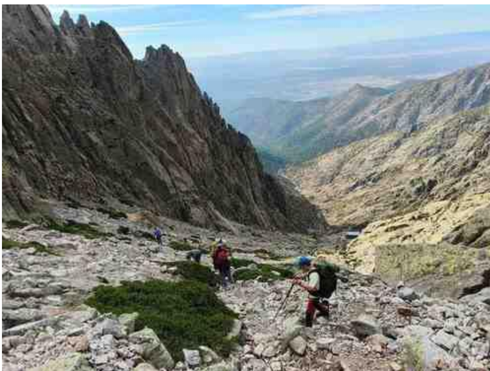
Ilustración 13. Refugio Victory

Antes de llegar al refugio giramos a la izquierda y comenzamos a subir con destino a la base del G.Galayo. Trepadas y más trepadas, hasta que llegamos a la base de la cumbre. Muy entretenido.