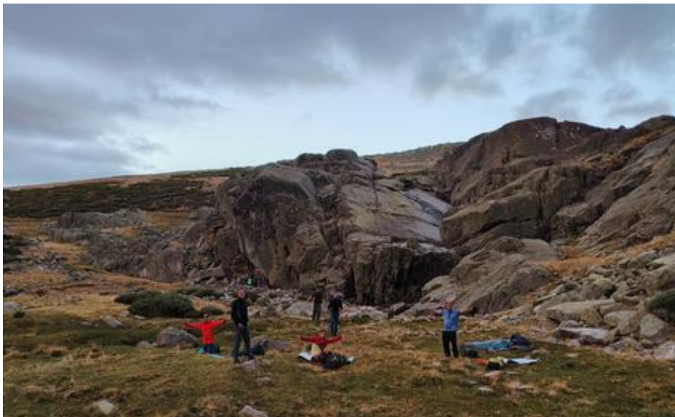
Ilustración 4. Vivac 1, primera noche

Una vez instalados, celebramos una reunión corporativa seguida de la cena. Más tarde disfrutamos de nuestra primera noche al aire libre: el cielo, despejado y sin nubes, nos regaló un espectáculo de estrellas, algunas fugaces, junto con el paso de satélites y aviones. Con esa experiencia dimos por concluida la jornada del viernes.