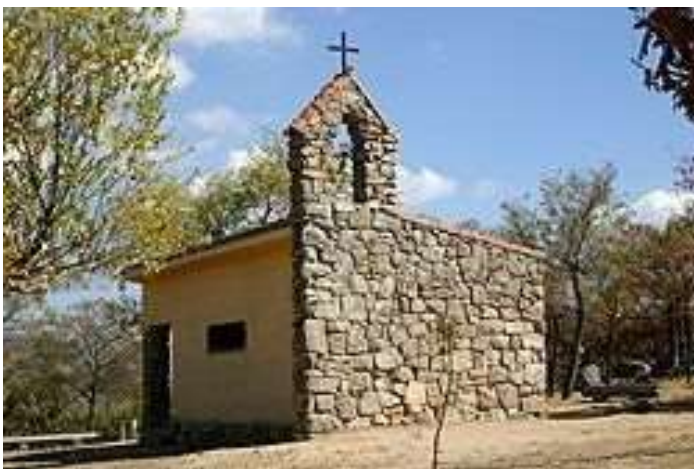
Ermita de San Antonio

Los amantes del patrimonio deberían visitar Navacerrada . La configuración urbana de la población –con muchas de sus calles empedradas y con edificios integrados en el entorno- y las muestras de arquitectura religiosa y civil hacen de la localidad un lugar ideal para experimentar sensaciones y disfrutar con cada rincón de Navacerrada.