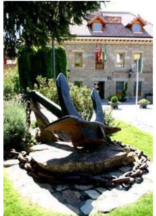
Plaza de los Ángeles

La fuente, construida en piedra, presenta cuatro pilones cuadrados que rodean un cuerpo pétreo vertical de donde mana el agua a través de cuatro caños ornamentados con motivos angelicales. Este cuerpo vertical está coronado con una lámpara con varios brazos que recuerda a los elementos decorativos palaciegos.