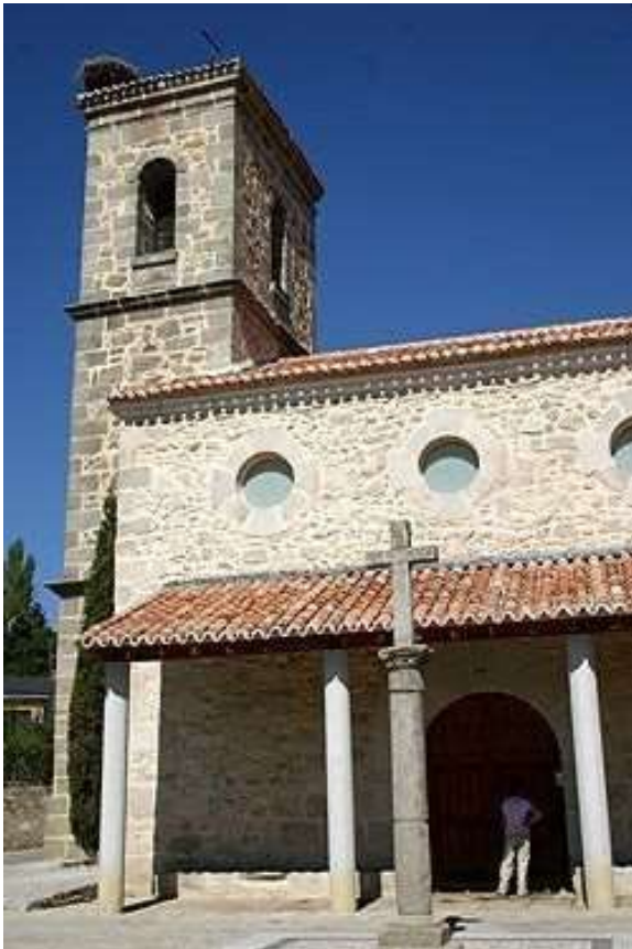
Iglesia de la Natividad de Ntra. Sra.

Esta Iglesia fue construida con mampostería y sillares en el siglo XVI y parte de ella fue restaurada en el siglo XVIII y en el XX.