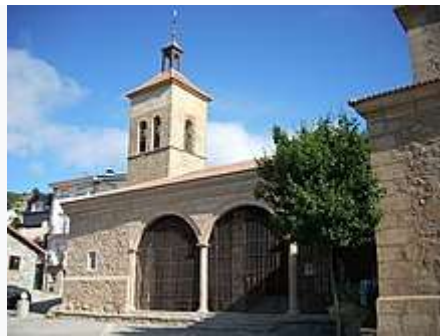
Iglesia de San Sebastián

El siglo XVIII viene marcado por la construcción del nuevo puerto del Guadarrama, hoy conocido por el nombre de puerto de Navacerrada, que quitará gran parte del tráfico que hasta entonces seguía transitando por la antigua calzada o por caminos alternativos que también atravesaban la Fuenfría.