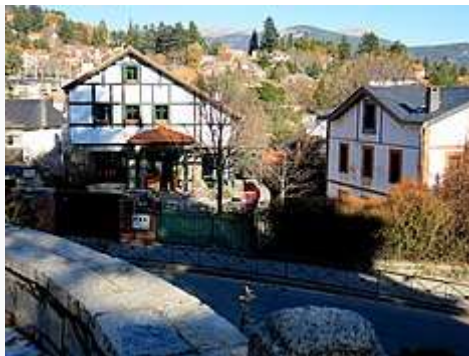
Arquitectura "tradicional" de la sierra de Guadarrama en Cercedilla.

Cercedilla está rodeada por varios montes de la sierra de Guadarrama, como Siete Picos, la Bola del Mundo, La Peñota y Peña del Águila.