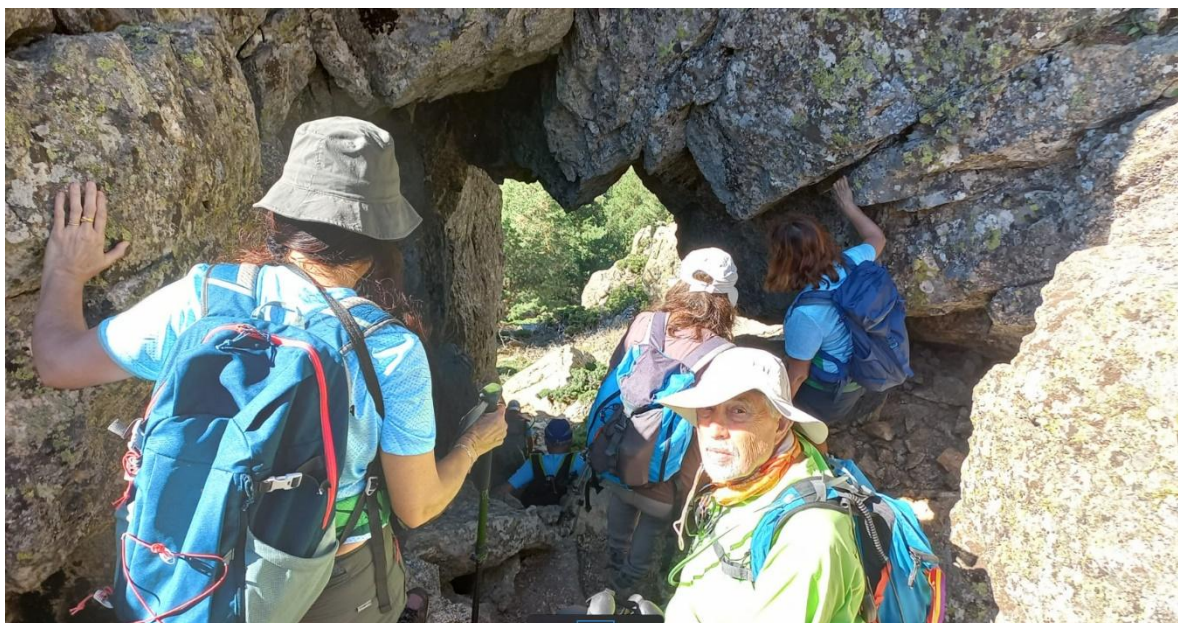
En la parte superior del Paso de la Cagalera

Se trata de un hueco o ventana entre rocas, con caída vertical de unos 10 metros y que hay que pasar de uno en uno y sin prisas. Cuenta con la ayuda necesaria para facilitar su paso, primero un cable al que nos agarramos para que nos sirva de soporte en los primeros metros y que nos facilita mucho el acceso a una vieja escalera metálica colgada entre las rocas, de unos cuatro metros de altura.