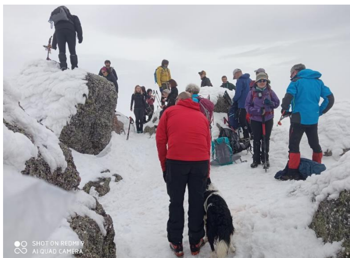
En el pico de Urbión

Todo el grupo pasó por el cerro del Fraile, el pico Toscoso, la peña Triguera, el Muñalba y el Tres Provincias, donde algunos optaron por bajar directamente a la ciudad encantada de Castroviejo y el resto continuó bordeando el circo del Urbión, pasando por el Camperón y las peñas Claras, con sus estupendas vistas de la laguna de Urbión para, igualmente, bajar a la ciudad encantada de Castroviejo, deambular por entre sus formaciones pétreas, subir al mirador y, algunos, llegarse hasta la Cueva Serena, atravesar la cascada y hacer la foto desde dentro.