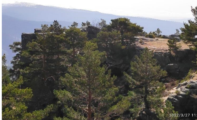
El Peñedo del Empedrado, al fondo Urbión

Cada cual eligió la marcha que más le apetecía de entre las tres posibles, todas ellas por el camino que va cortando la carretera de las lagunas de Neila hasta llegar al comienzo del circo de las lagunas de las Pardillas, de los Patos y Brava, allí se desvió el grupo de los que optaron a bajar hasta Quintanar por el Empedrado, una amplia clara en el pinar, en parte pradera y en parte suelo rocoso, llano y con multitud de grietas, algunas de ellas bien anchas, que se asoma a acantilados respetables y con muy buenas vistas de los alrededores, la Peña Aguda por un lado y la cuerda larga de Urbión que transitamos ayer, por el otro. Lo siguiente fue volver al pinar para seguir el sendero hacia Quintanar, atravesar el pueblo y acabar la marcha en