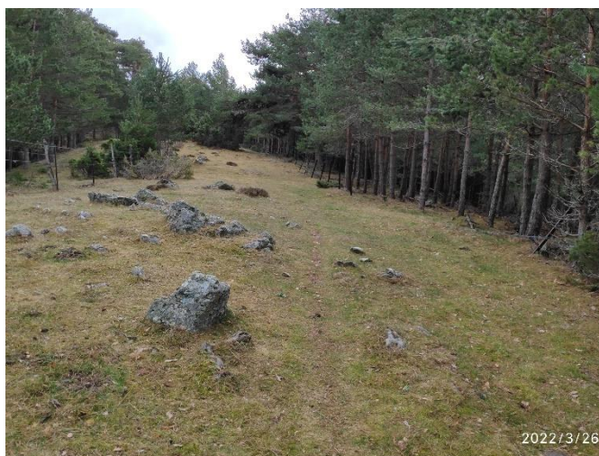
Por la cuerda

Empezamos a pisar nieve a partir de, aproximadamente, el pico Toscoso (1900m), una capa poco profunda en buen estado para andar por ella, de modo que la caminata se pudo hacer a buen ritmo y con buena visibilidad.