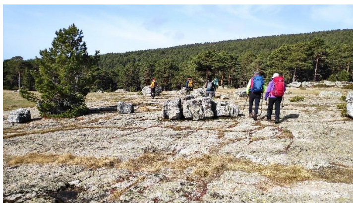
Saliendo del Empedrado