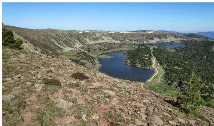
Lagunas de Neila desde la subida al borde del circo

Un segundo grupo continuó hasta llegar al Campiña y, desde allí, bajar al pinar hacia el paraje de Fuentelsaz, buscando la mejor forma de progresar por el sendero, algo oculto por el ramaje caído y no recogido, hasta llegar al camino que, relativamente cerca del río de las Gargantas, llega hasta Quintanar y, atravesando el pueblo, acabar en el hotel.