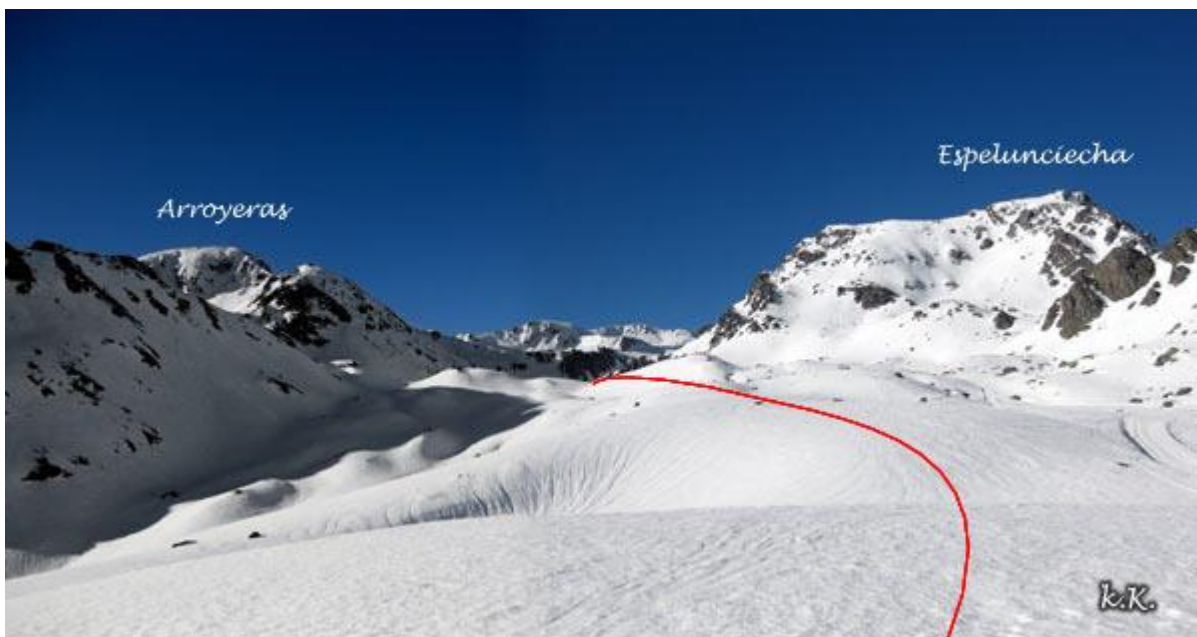
Flanqueo de la Glera de Anayet bajo el Espelunciecha y acceso al Barranco de Culivillas

En la cabecera del barranco, dejamos a la izquierda los tubos que van hacia el Arroyeras, para subir por la derecha hacia los Ibones de Anayet.