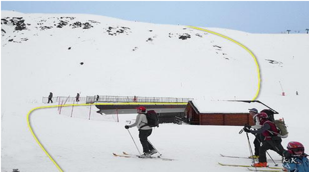
Subida a la Glera de Anayet desde las pistas

Avanzaremos llaneando con el Espelunciecha al frente, el cual dejaremos a nuestra derecha, haciendo después un ligero descenso a la izquierda para entrar al barranco del Culivillas .