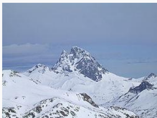
Pico Midi d'Ossau en invierno

En este valle se encuentra el Pico de Midi d'Ossau.