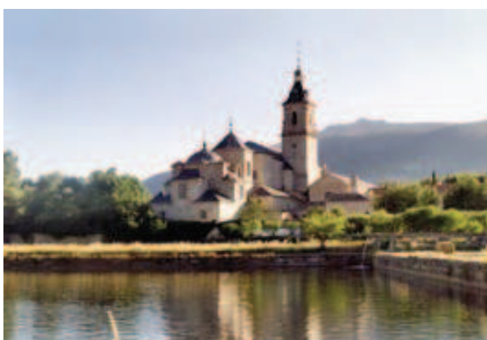
MONASTERIO DEL PAULAR