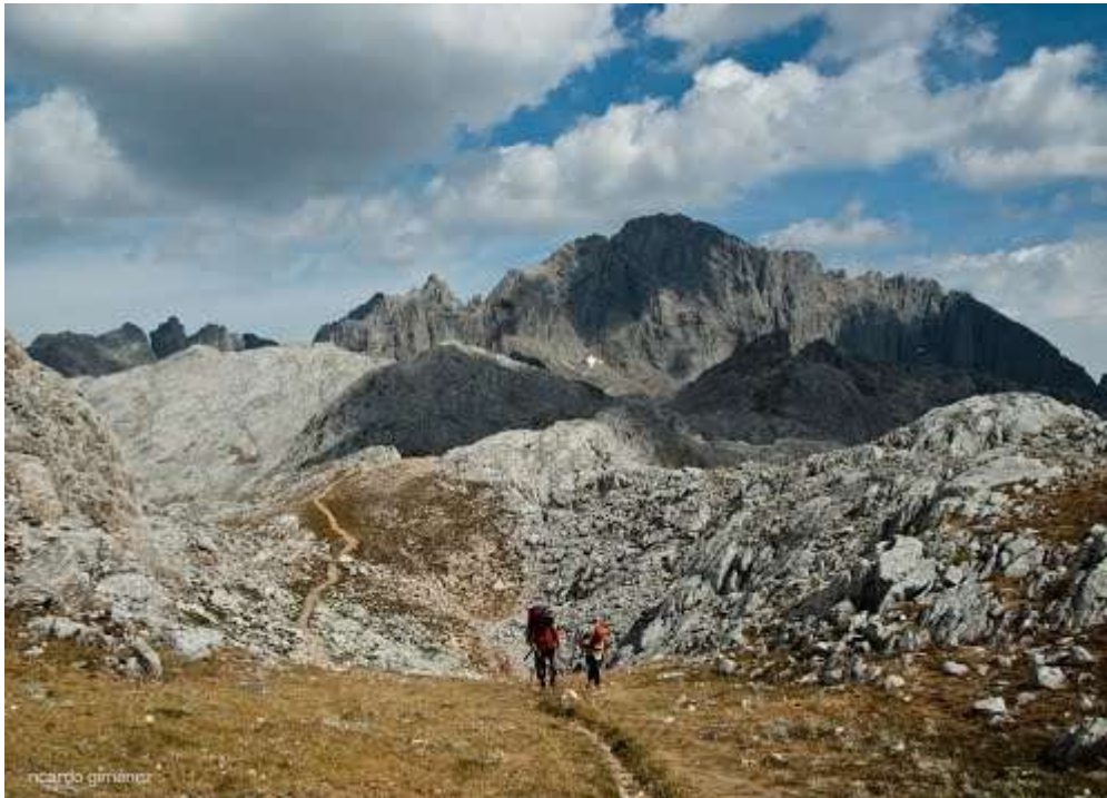
Camino del Burro

En el collado del Burro enlazaremos con la ruta Vegabaño-Vegaredonda, 3ª etapa del conocido anillo de Picos, que seguiremos en sentido contrario al habitual, en dirección a Vegaredonda. En el collado del Burro tomamos el camino del mismo nombre, que durante aproximadamente un kilómetro discurre entre zona de lapiales.