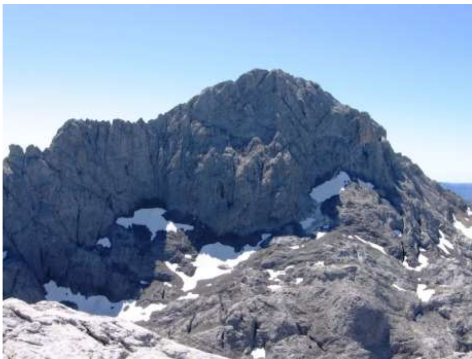
Vista de Peña Santa desde la Torre de los Traviesos

Los que quieran subir a la Torre de los Traviesos, tendrán que desviarse hacia la izquierda (hacia el este) y remontar o encaramare (tras un tramo un poco más complicado) a la cresta que llevará hasta la base del Pico de los Asturianos. Se rodea el pico de los Asturianos por su cara norte, dando vista al Jou de la Canal Parda y a la Torre de los Traviesos. Para ascenderla cruzamos el Jou de la Canal Parda sin perder demasiada altura, hasta ganar la cresta que une la Torre de la Canal Parda (2.369 m) con la cumbre de Los Traviesos (2.385 m).