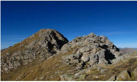
Hacia Punta Agüerri