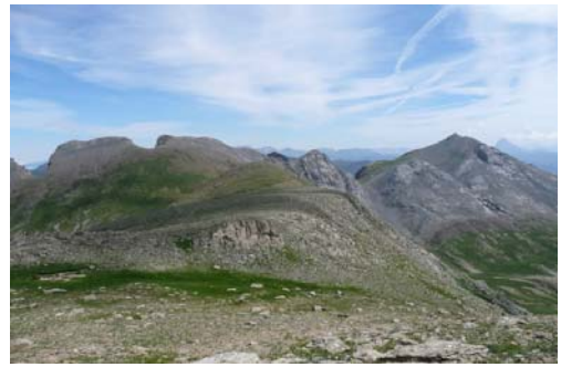
Puerto de Taxera y cumbre de Costatiza a la derecha

(**) Opción Bisaurín: Desde la salida y tras recorrer algo menos de 3 km, nos dirigiremos hacia el Sur hasta alcanzar el Puerto de Vernerá (1774 m), y tras girar a la derecha en el Ibón de Estanés (1760 m), se alcanza el GR 11 (1903 m). De aquí a la Brecha Secús (2.245 m) y Collado de Secús (2.401 m) culminaremos en el Pico Bisaurín (2.670 m). Descendiendo hasta el Colláu de lo Foratón (2016 m) alcanzamos el GR 11.1