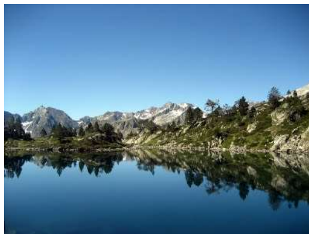
Imagen desde lac d'oredon

Lagos verdes, azules, entre el rudo granito con líquenes naranjas y amarillos... Pinos centenarios, marmotas con sus temblorosos bigotes entre los rododendros... Amanecer y puesta de sol resplandeciente, cimas brillantes en la profunda claridad... Esta colorida y vivificante estancia, ¡os maravillará! Los paisajes del macizo de Néouvielle han sido trabajados y re trabajados por largos periodos glaciares que, al acabar, dejaron estas cimas y crestas características, dominando las extensiones consteladas de lagos.