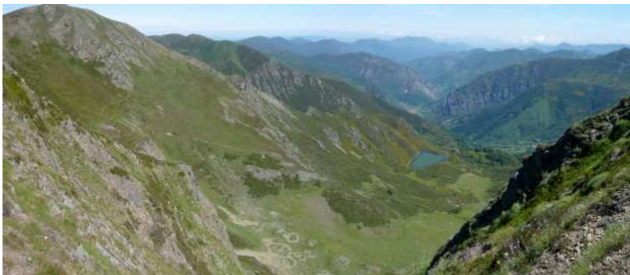
Ascendiendo el Cogollu Cebolfeu con el cordal que deberemos seguir.

Desde El Cogollu veremos el Lago Bueno –de acceso prohibido-, en Somiedo .