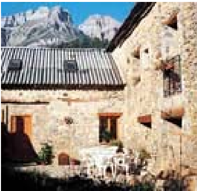
Albergue de Piedrafita de Jaca

El viernes 24 y el sábado 25 nos alojaremos en el Albergue Piedrafita, en Piedrafita de Jaca, el resto de los días pernoctaremos en refugios de montaña