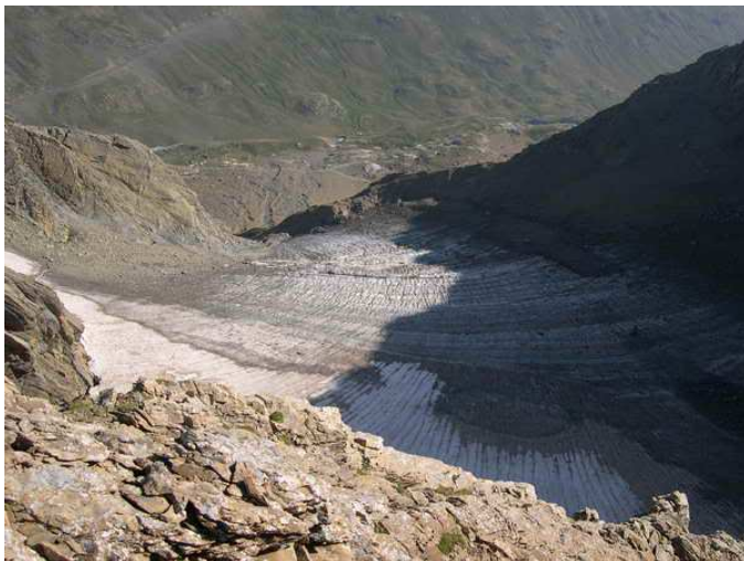
< Gabeto Oriental