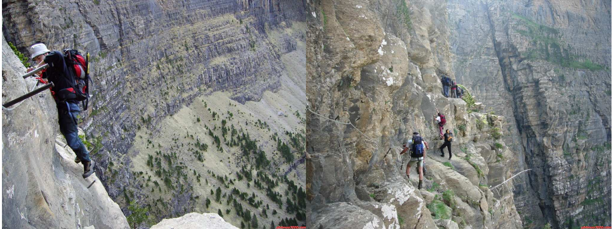
Clavijas de Cotatuero

Amplio circo lateral de origen glaciar, situado al este del de Carriata, delimitado por los altos farallones de Gallinero y Fraucata. Impresionante cascada de agua considerada como una de las más altas de la península Ibérica. Bosques de abeto blanco y pino negro. Paso delicado con clavijas -colocadas por un herrero de Torla en el año 1881 para facilitar el acceso a las zonas altas de cazadores ingleses- que permiten salvar la impresionante verticalidad de un terreno rocoso.