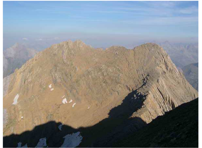
Los dos Gabetos ^