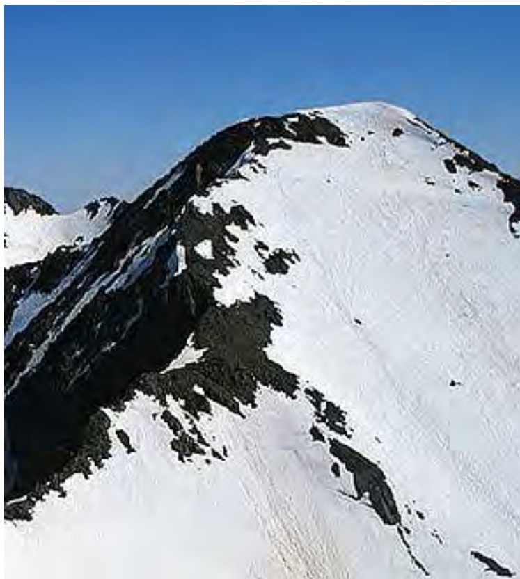
Cima del Garmo Negro.