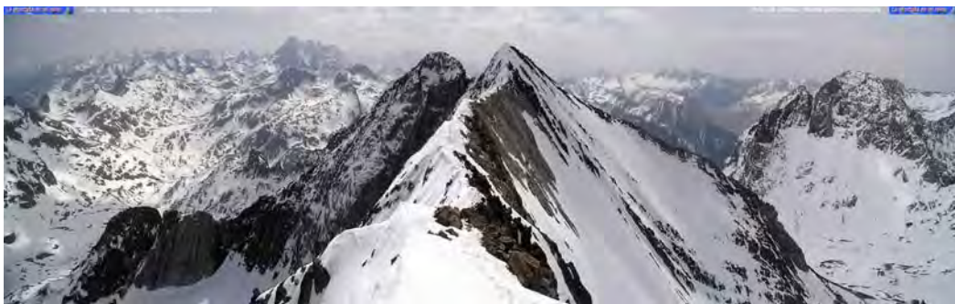
Arista del Infierno Central, Al fondo , a la izquierda de la cresta, el Vignemale. A la derecha, cercano, el Garmo Negro.

El macizo de los Infiernos y las Argualas es una zona muy visitada. Su fácil aproximación desde el Balneario de Panticosa tiene bastante que ver con esto. Partiendo de aquí, te puedes plantar en la cima de cualquiera de estos picos en menos de 6 horas, y te da la oportunidad de coronar varios en un mismo día, debido a su proximidad. Es fácil coronar el Garmo Negro, Algas y Argualas en una misma ascensión, siendo ésta una de las ascensiones más realizadas en la zona.