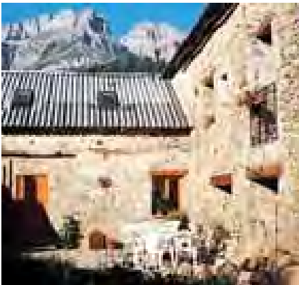
Albergue de Piedrafita de Jaca 974 487 627

Es necesario llevar saco o saco sábana y toalla.