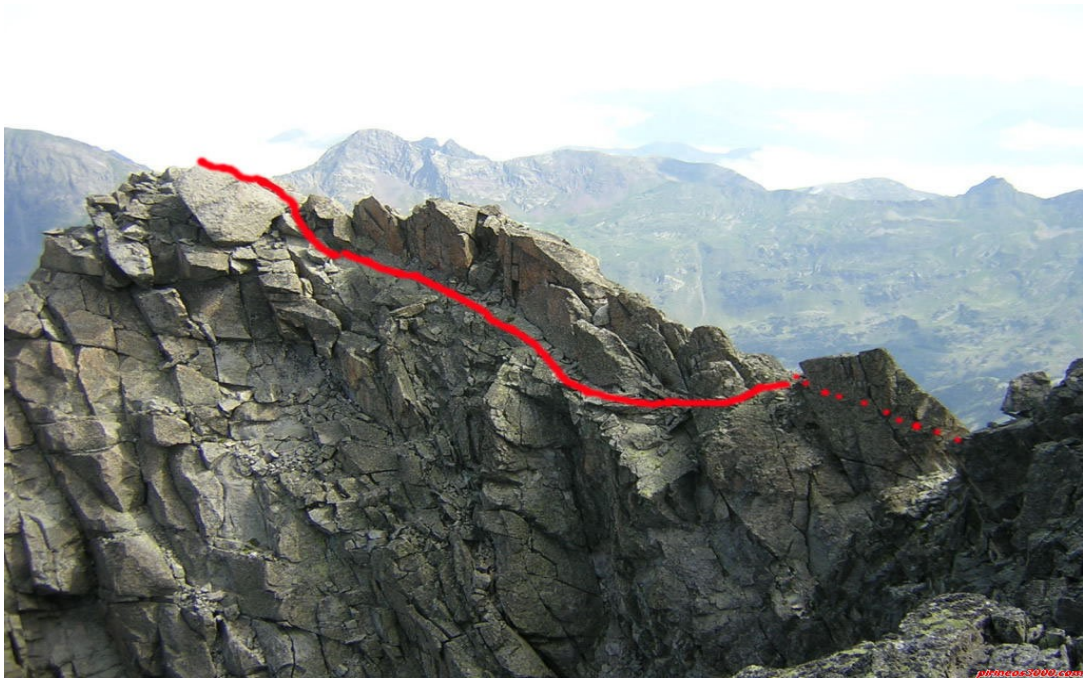
Ultimo tramo de la cresta a la Punta Delmás