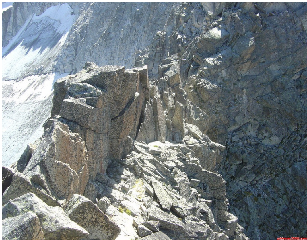
Desde la cima, vista hacia el collado previo

Desde esta cima tenemos una vista inmejorable de la Torre Cordier y el famoso collado que la separa del contrafuerte Norte del Pico Cordier. Prácticamente parece que no haya desnivel aunque evidentemente si lo hay.