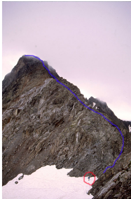
Subida al Pic Long

Descendiendo de la aguja, nos vamos directamente a la Horcada y allí, por cresta (en este tramo cambia ya la calidad de la roca, teniendo buenos agarres)