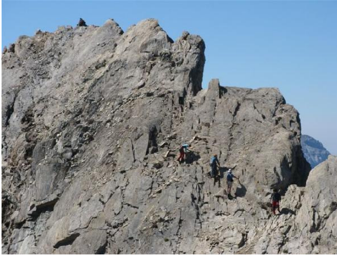
Descenso del Maou