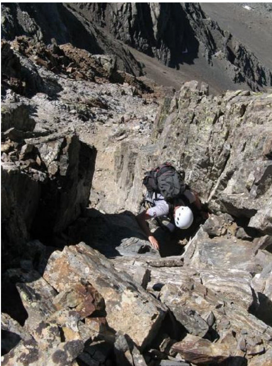
Chimenea hacia la aguja Badet

Después de nuestra 2ª cumbre, viene el tramo más complicado de la travesía. Lo peor de todo es que la roca está muy rota, por lo que hay que andar con mucho cuidado. Continuamos por la cresta evitando los principales obstáculos hasta que alcanzamos la horcada del Pic Long. Antes de llegar a dicha horcada, podemos acceder a la chimenea más sencilla de lo que parece a primera vista que nos sube a la Aguja Badet (3135 m) (Poco Difícil).