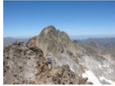
Pic Long desde el Pic Badet

El camino va en general por la cara oeste, yendo en algún momento a plena cresta, y de vez en cuando toca emplear las manos para progresar. En la cima del Badet encontraremos un gran hito (3160 m) (Poco Difícil Inferior)