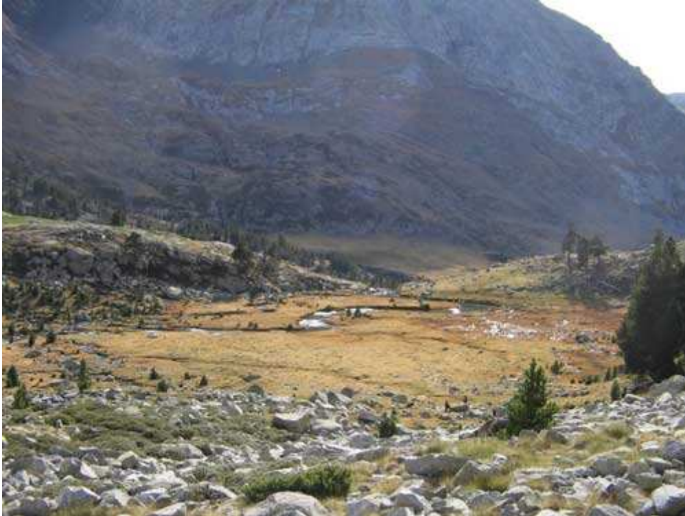
Descenso a la Pleta de Llosás

En total desde la cima al refugio, y como siempre muy despacito y con paradas, llegamos en 4h 20'