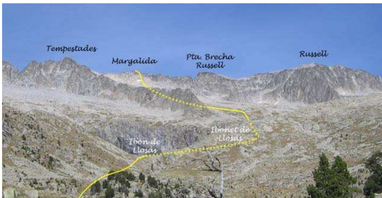
Ascensión al Margalida

0:25 Pasamos junto al desvío del Pico Vallibierna , que no está marcado por carteles pero hay unos hitos hacia la derecha. Nosotros seguimos al frente por camino muy pisado, que empieza ahora una ligera subida, tras la cual desaparecen los árboles pudiendo ya verse el Margalida como un pequeño pico algo afilado, con el Russell a la derecha y el Pico Tempestades a su izquierda; siguiendo la cresta más a la izquierda puede verse la Espalda de Aneto y el Aneto.