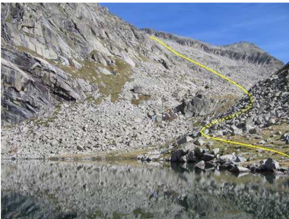
Rodeo del Ibón de Llosás para acceder al Ibonet, y posterior subidón desde éste

1:35 Ibón Llosás , lo rodeamos por la derecha para seguir ascendiendo por el barranco que forma el torrente que baja del Ibonet al Ibón. Tras cruzar el torrente del barranco subimos ligeramente hacia la izquierda.