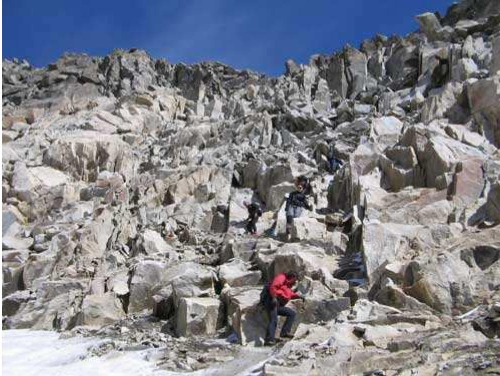
Descenso visto desde la base del pico

Una vez abajo, y alejados de la pared para evitar posibles caídas de piedras, paramos a comer, ya que con las prisas por bajar por si se complicaba demasiado el descenso, ni comimos ni bebimos en la cima.