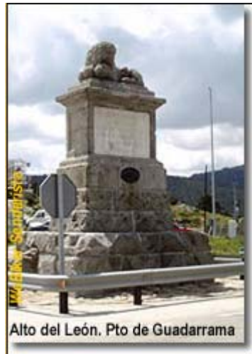
Comienzo de la ruta