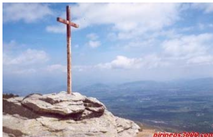
Cima de Abantos