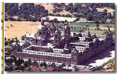
Fin de la ruta.- San Lorenzo