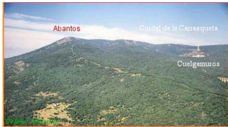
Alto de Abantos