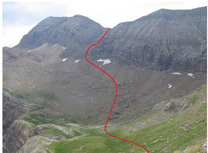
Descenso al llano desde la arista del Ibón de Iserías, y subida del corredor

Desde el llano se sigue el camino marcado por hitos que ascienden un poco a la derecha, por pedregal hacia el pie de la pared, hasta llegar a un ancho corredor