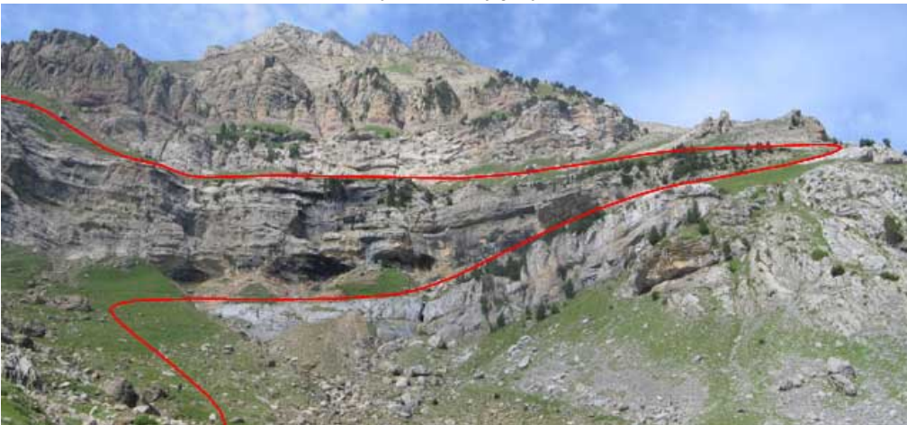
Fajas de subida y giro junto a la Cabaña Vuelta de Iserías

Tras descansar un momento en la cabaña de Iserías continuamos para arriba por el camino, que en el punto de la cabaña hace un fuerte giro a la izquierda para pasar por otra faja por encima de las paredes rocosas a cuyo pie estaba el tramo anterior del camino. El sendero