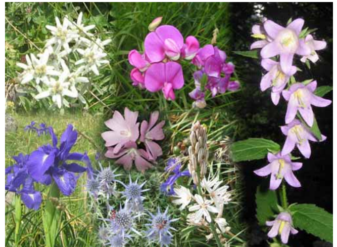
Algunas de las flores del camino

Llegamos al pueblo tras más de 10 horas de caminata entre los dos valles emblemáticos de este paraje singular.