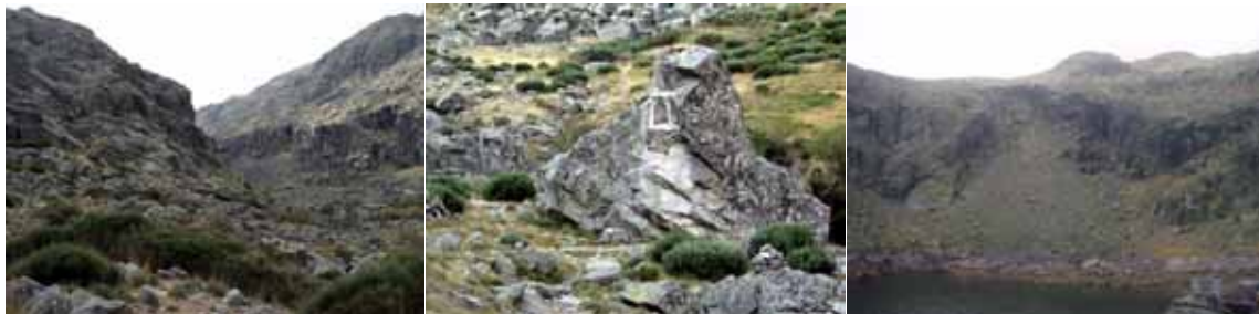
Laguna de la Nava