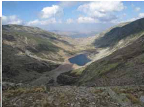
Laguna del Barco

A la derecha del amplio y larguísimo valle por el que desagua la laguna crecen multitud de servales que van perdiendo su color rojo y a nuestra espalda el sol se va ocultando. Temo que la noche nos alcance, no conozco la bajada y pido consejo por la emisora... "Siempre por la derecha del arroyo". Encontramos la polvorienta pista forestal a tiempo para llegar poco antes de que nos invada la noche.