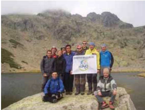
Laguna de Los Caballeros