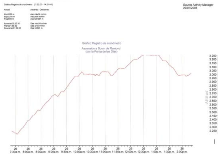
Perfil de la ascensión al Soum de Ramon desde Goriz